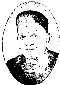
भी दोहराम गुर, अलीगढ़